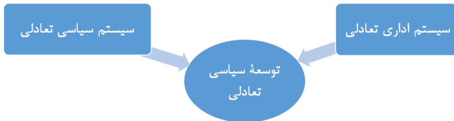
شکل ۱. مدل کلی توسعه سیاسی تعادلی

تحولات در عرصه مدیریت امور عمومی بیانگر آن است که سیاست و اداره در چارچوب ارتباطی متقابل نقش بهینه‌ای در عرصه سیاست‌گذاری عمومی دارند. به عبارتی توسعه سیاسی و اداری از یکدیگر تأثیرپذیرند و قلب حکومت را تشکیل می‌دهند. توسعه سیاسی مقوله‌ای بنیادی دارای ابعاد سیاسی و اجتماعی که علاوه بر وجه ذهنی و رفتاری، تنظیمات بین دولت و جامعه را در قالبی نهادمند و پویا برقرار می‌سازد و در ساختار و ترتیبات نهادی دولت هم اثر می‌گذارد. بنابراین توسعه سیاسی در دو سطح دولت و جامعه سازمان‌دهی می‌شود و اساساً عملکرد سازمان‌های دولتی سیاسی است و آن‌ها در بستر سیاسی شکل می‌گیرند (Waldo, 1948, p. 141).