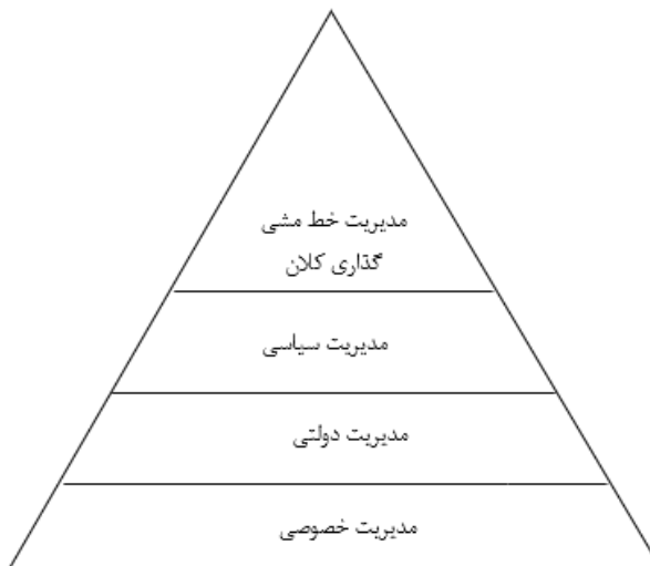
شکل ۱. سطوح مدیریت در ایران

در ایران چهار سطح برای مدیریت قائل شده‌اند که چهار سطح خط‌مشی‌گذاری را ایجاد می‌کند. این سطوح در شکل ۱ آمده است. ۱. سطح مدیریت ابرخط‌مشی‌ها که رهبری نظام و مشاوران تخصصی ایشان این وظیفه را برعهده دارند. ۲. سطح مدیریت سیاسی که برعهده قوای سه‌گانه است و خط‌مشی‌های میانی در این سطح تدوین می‌شود. ۳. سطح مدیریت اداره امور عمومی که اجراکننده خط‌مشی و مشاوره‌دهنده در تدوین خط‌مشی است. ۴. سطح مدیریت بخش خصوصی که فقط به بخش خصوصی مربوط نیست و به کلیت جامعه اشاره دارد و می‌تواند با یک مدیریت دولتی کارآ و اثربخش در جهت بهبود و رشد جامعه عمل کند (دانایی‌فرد، ۱۳۹۵، ص. ۳۸۷).