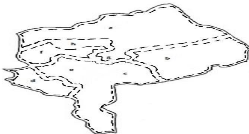
شکل-۲. حوزه‌بندی براساس قومیت فارس

همچنین در مورد قومیت بلوچ این استان مناطق به صورت زیر دارای کرسی نماینده بلوچ می‌شوند: بعد از اجرای مدل شناورسازی مرز حوزه‌های انتخابیه برای قومیت بلوچ، ابتدا منطقه C که بزرگترین جمعیت بلوچ را داراست بررسی شد و سپس به ترتیب جمعیت‌های باقیمانده، مناطق b, e, g و h بررسی شدند و بقیه موارد معین مناطق محسوب شده‌اند. حوزه‌بندی‌های جدید برای قومیت بلوچ در استان مورد مثال به شکل، منطقه C در کنار منطقه معین d با فرمول سوم دارای یک کرسی نمایندگی بوده و حوزه انتخابیه آن شامل مرز هر دو منطقه است، منطقه b در کنار معین a با فرمول سوم جدول دارای یک نماینده و با مرز حوزه انتخابیه منطبق بر مرز هر دو منطقه، منطقه e با معین f با فرمول دوم هیچ نماینده‌ای نخواهند داشت و فاقد حوزه انتخابیه هستند و نیز دو منطقه g و h هرکدام مجزای از یکدیگر و هر دو فاقد معین بوده که با فرمول دوم فاقد نماینده و حوزه انتخابیه هستند. مرزبندی حوزه‌های انتخابیه مبتنی بر قومیت بلوچ در استان مورد مثال به صورت خط‌چین‌ها در شکل زیر آورده شده‌اند: