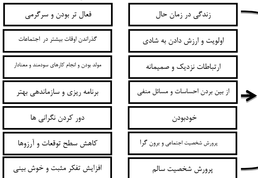
نگاره ۱: اصول چهارده گانه «فوردایس» جهت افزایش شادمانی (نیاز آذری، ۱۳۹۳: ۴۰)

فوردایس نیز دو جنبه ذهنی و عملی را در ایجاد شادی موثر می‌داند. وی هفت اصل را به حیطة ذهن و نوع تفکر و نگاه افراد به جهان پیرامون خود اختصاص داده و ۷ اصل دیگر که یک به یک متناظر با اصلی ذهنی ماقبل خود هستند، در حقیقت جنبه رفتاری و عملی همان اصل هستند. با این توضیحات به روشنی در می‌یابیم که نظر استرن (۲۰۱۰) به طور بارزی از نظرات فوردایس (صاحب‌نظر در حوزه روانشناسی شادی در سال ۱۹۹۷) تأثیر پذیرفته است.