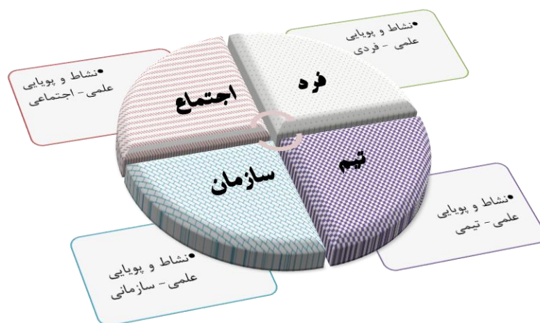
شکل ۱: ابعاد نشاط و پویایی علمی (برگرفته از یافته‌های پژوهش حاضر)

"پویایی علمی- فردی" را می‌توان اشتیاق و علاقه‌مندی فرد به مطالعه مستمر، پژوهش، یادگیری مادام‌العمر، حق‌خواهی، حق‌گستری، نقدپذیری، آینده‌نگری، ارزش‌آفرینی، اثرگذاری مؤلد و اثرپذیری ارزشمند در دانشگاه، جامعه، و جهان دانست؛ "پویایی علمی- تیمی" را می‌توان برخورداری از اشتیاق، پیشگامی، علاقه‌مندی و استقبال از مشارکت موثر و مؤلد در شکل‌دهی، شکل‌گیری، بهبود و همکاری در تیم‌های دانش‌بنیان، کارآفرین، ایده‌پرداز، و فعالیت‌های فرانشی برای حضوری ارزش‌آفرین، حق‌محور، و تعالی‌بخش در تیم‌های علمی خودجوش و فداکار برای تحقق هدفی معین و ارزشمند، تعریف نمود؛ "پویایی علمی- سازمانی" را حرکتی هماهنگ، پرشتاب و هم‌جهت با اهداف علمی و آموزشی تعیین‌شده از سوی اسناد بالا دستی؛ نهادینه سازی فرهنگ مدیریت دانش، یادگیری سازمانی و تلاش برای تحقق سازمان یادگیرنده؛ ایجاد ارزش‌افزوده سازمانی و مدیریت موثر و یکپارچه سازی روندهای حرکتی فردی، تیمی و سازمانی؛ و "پویایی علمی- اجتماعی" را دغدغه، اشتیاق و ارج نهادن برای مشارکت‌دهی فرهیختگان، دانشجویان، اساتید، و سایر ارکان دانشگاهی در مسائل سیاسی، اقتصادی، فرهنگی، آموزشی و اجتماعی، بهره‌مندی از فرصت‌ها، ظرفیت‌ها و مزیت‌های دانشگاه، مراکز علمی و فرهیختگان و رفع مشکلات اجتماعی به‌منظور زمینه‌سازی برای تحقق آرمان جامعه شایسته‌پذیر، حق‌مدار، و دانشگاه جامعه - محور از طریق ارزش‌آفرینی، تولید ثروت، اقتدارآفرینی ملی و بین‌المللی، و تعامل‌سازنده در اثرپذیری و اثرگذاری متقابل، معنا کرد.